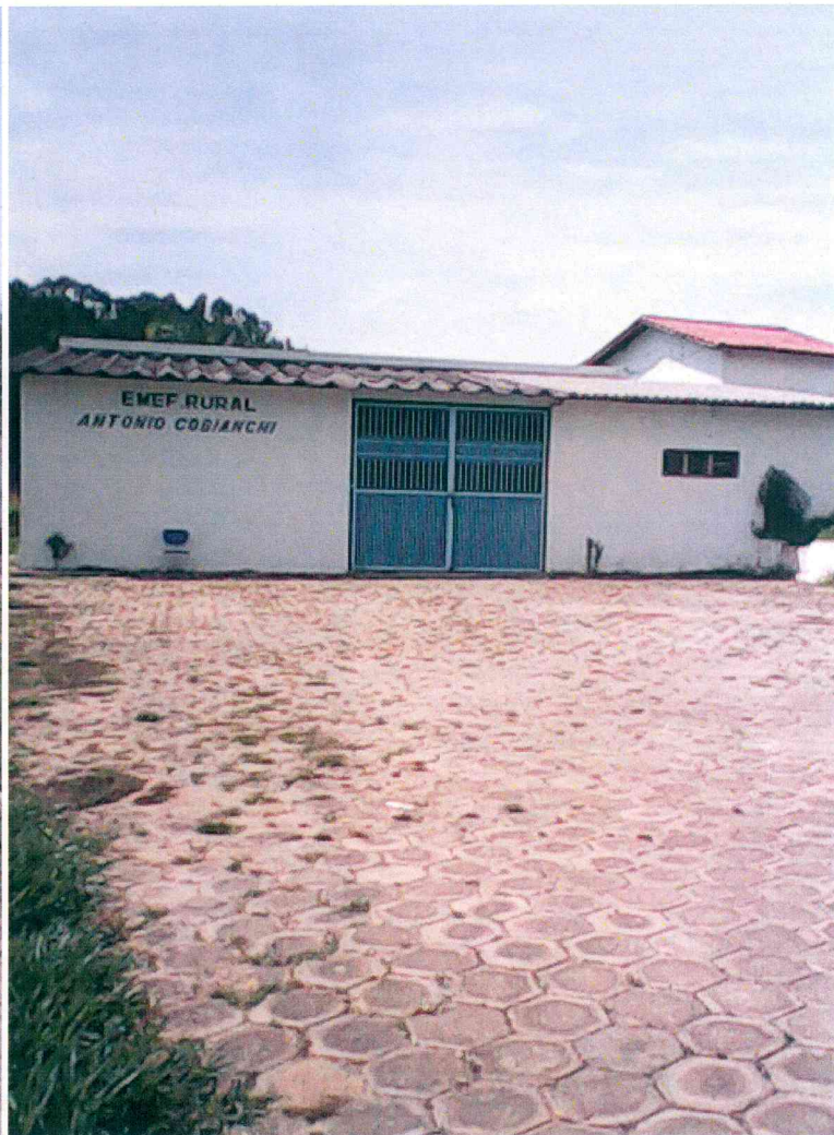
Igreja de São Benedito e Escola Municipal Antonio Cobiانchi ambos localizados no bairro Cantagalo, zona rural do Município de Canas-SP.